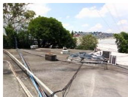
Prepara la Superficie.