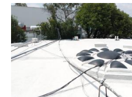
Terminación con Reflejante Acrílico a dos manos.