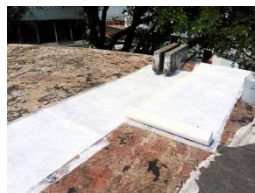
Aplica un tramo corto de Sellador Texturizado y fija la Membrana sin arrugas o bolsas.